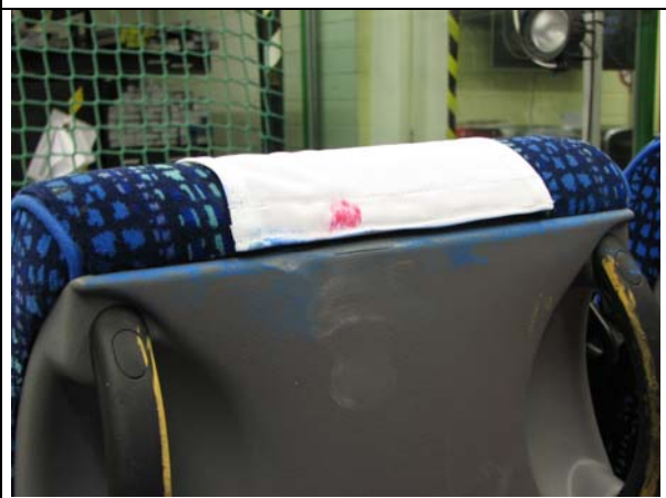
Abb.6: Rückenschale nach dem Versuch