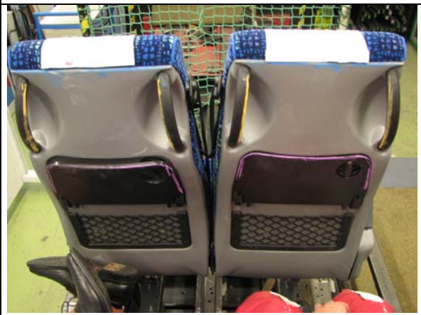
Abb.4: Rückenlehne – nach dem Versuch