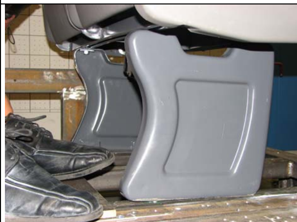
Abb.5: Anbindungen nach dem Versuch