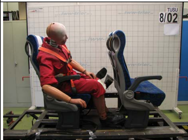
Abb.3: Anordnung nach dem Versuch