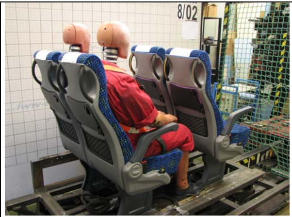
Abb.2: Anordnung vor dem Versuch