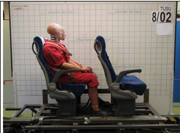
Abb.1: Anordnung vor dem Versuch